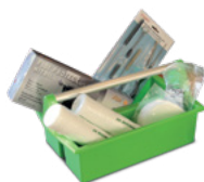
Caixa de Ferramentas Prolaq Código G90010-01

Suporte para caixa de ferramentas Comercializado individualmente