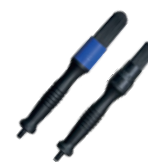
Escovas de Fluxo de Limpeza para PROLAQ Compact

Caixa de ferramentas com acessórios, com alça de transporte em alumínio. Cor: Verde