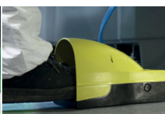
Acionado por ar comprimido, através de pedal