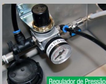
Regulador de Pressão