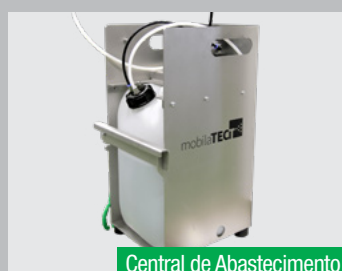
Central de Abastecimento